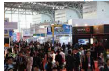
SAE-China Congress & Exhibition