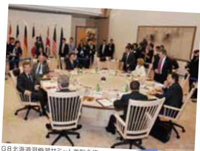
G8北海道洞爺湖サミット首脳会議