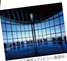
六本木ヒルズ東京シティビュー(展望台)