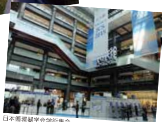
日本循環器学会学術集会