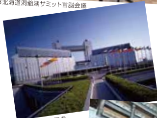
名古屋国際会議場