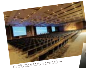
コングレコンベンションセンター